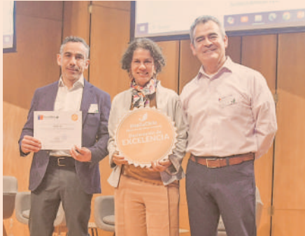
HuellaChile reconoció las acciones y programas de Sodimac para reducir el impacto de sus emisiones.

En 2023, Sodimac disminuyó su huella de carbono en 31% respecto al año anterior considerando los tres alcances, incluyendo el impacto por fabricación, uso y fin de vida de productos vendidos. La huella de carbono ascendió a 1.769