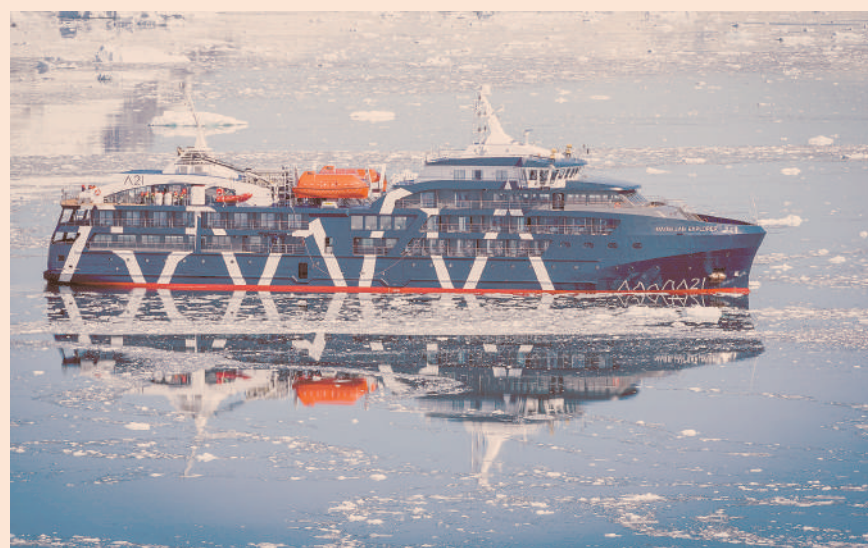
El buque de expedición antártica Magellan Explorer.

“Una de las principales herramientas para