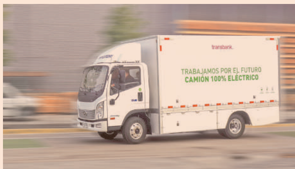
Gracias a la implementación de esta tecnología, la compañía logró disminuir más del 70% de las emisiones en relación a un transporte convencional.