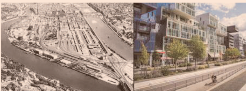
El antes y después de La Confluence en Lyon, París (a la izquierda, durante su pasado industrial y a la derecha, la situación actual, después de implementada la remediación y posterior desarrollo urbano)