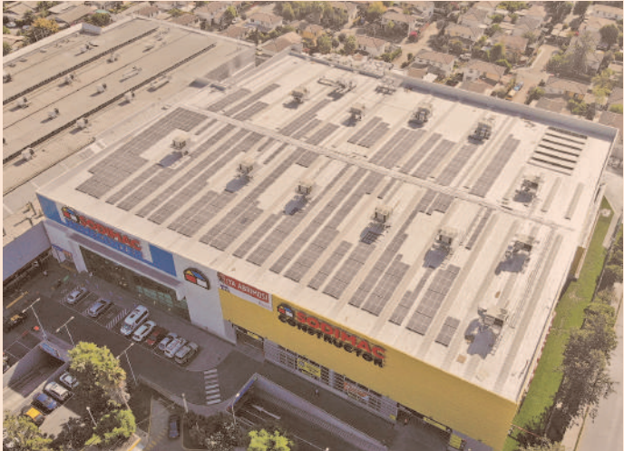
Actualmente, 49 tiendas de Sodimac de Arica a Puerto Montt se abastecen con paneles solares.

“Agradecemos este reconocimiento, que refleja nuestro compromiso con la acción climática.